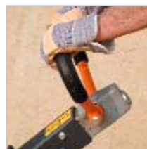
Commandes d'inverseur aisées