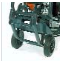
Roues pour transport