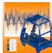
Qualité de conception et de fabrication